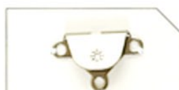
SKH05 HB (黒Ni)

※表示しているレールの色、長さは6型を除いて標準のセットです。 レールの変更がある場合はご連絡ください。