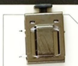
SKH04 (MB) (権利) 黒Ni 20m/m (黒専用レール)