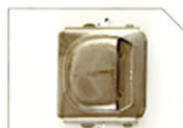
SKH03 (MB) (権利) 黒Ni 20m/m (白短レール)