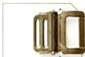
SKH01 (MB) (権利) 黒Ni 20m/m (白短レール)