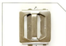
SKH02 (MB) (権利) 黒Ni 20m/m (白短レール)